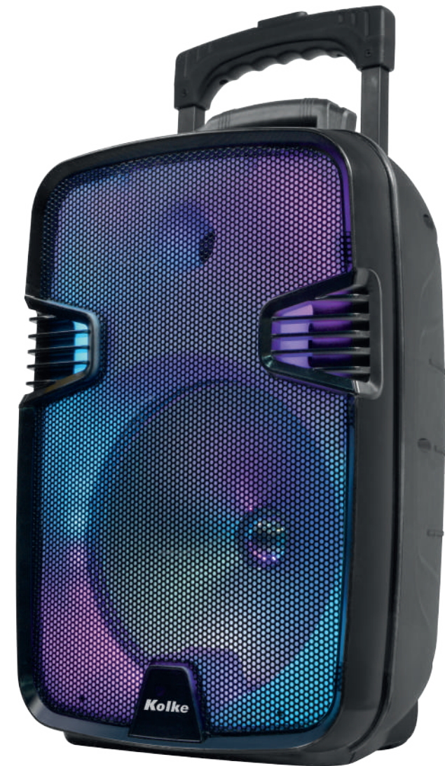
Parlante Burner de 12" KPB-525