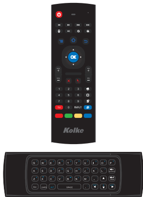
Air mouse 55-SMU